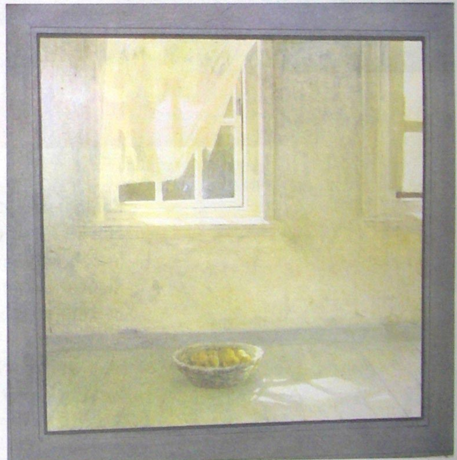
Hetzelfde schilderij als hierboven, dan als geheel.

Een andere grootheid van vroeger, de Italiaanse schilder, beeldhouwer en architect Leonardo da Vinci (1452-1519) is altijd een belangrijke inspirator en leermeester voor de Burgumer geweest. Dat wordt ook in de titel van de expositie in het Dordrechts Museum ('Leonardo's Leerling...') duidelijk in beeld gebracht. "Leonardo da Vinci is tijdens mijn hele carrière op de achtergrond altijd aanwezig ge-